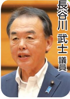
長谷川 武士 議員

佐藤市長 経営規模の大きい30ha以上の水田を耕作する個人農業者は、直近3年間で1.4倍以上に増加。将来にわたって地域の農地を守り、持続可能な農業経営を実現できるように、引き続き、集団化・組織化につながる支援を基本としながらも、一定規模以上の農地を耕作する個人農業者に対する支援について検討を進める。