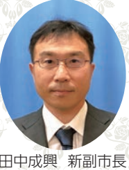
田中成興 新副市長