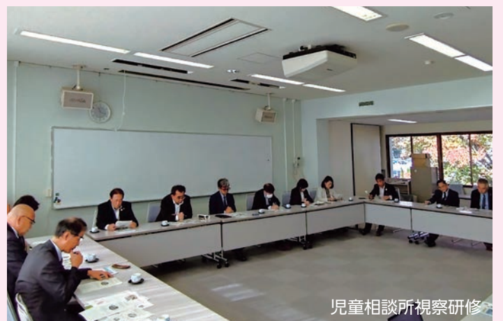
児童相談所視察研修