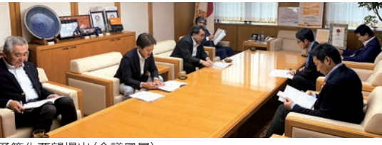
予算化要望提出(会議風景)

公共交通関係部署の組織の統一(交通部の設置) 子どもの家や放課後子ども教室などの子どもに関する分野を子ども部へ集中 官民共創のまちづくりの推進 民間の持つノウハウ・技術・資金を積極的に活用するPPPの推進と庁内体制の整備 地域経済循環・地域力の育成強化につながる各種事業者選定方法の見直し