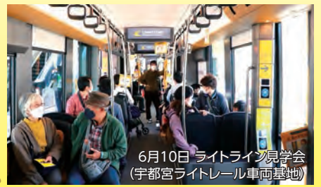
6月10日 ライトライン見学会 (宇都宮ライトレール車両基地)

我々、自由民主党議員会は市内の子どもたちが先行して試乗できるような企画などを要望し、多くの方々に参加し、記憶に残るイベントが検討されています。