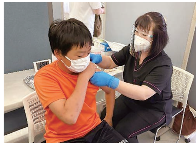
宇都宮市の集団接種の様子

接種によって得られる「効果」と「副反応」を正しく理解し、自分や家族など大切な人を守るため、総合的に判断してください。ご自身の体質や体調など、判断に迷う時には、かかりつけ医にご相談ください。