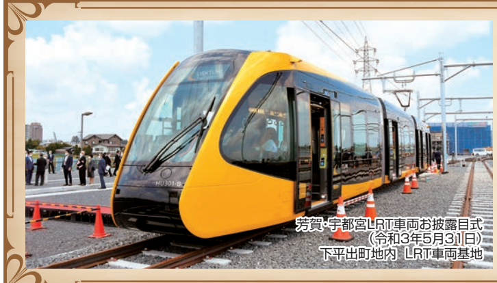
宇都宮LRT車両お披露目式 (令和3年5月31日) 下平出町地内 LRT車両基地